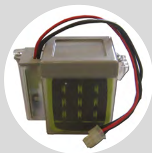
Batterie de secours