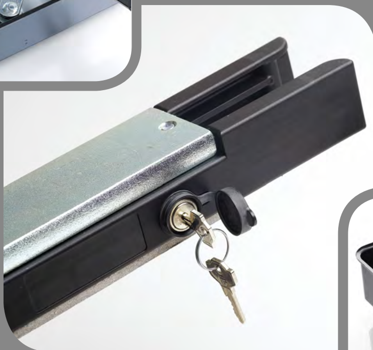
Déverrouillage par clé facile d'utilisation